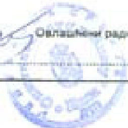
ОБРАЗАЦ (ОП) – Оверени потписи лица овлашћених за заступање